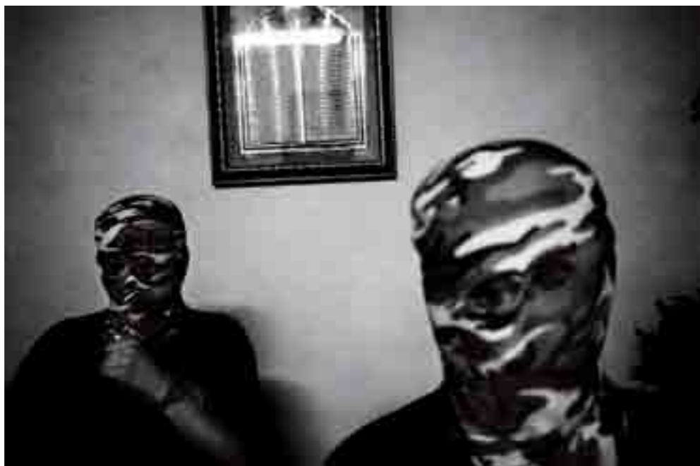
Membres de la Brigade des Martyres de al-Aqsa à Gaza. Palestine, 2004