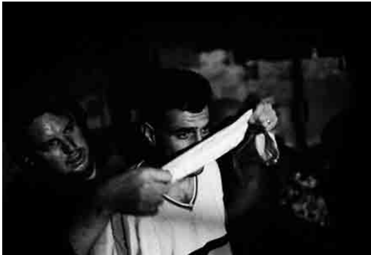
Un palestinien arrêté et bandé pendant une opération militaire israélienne près de Jenin, Palestine, 2002

Paolo Pellegrin en a beaucoup raconté. Celles-ci sont parfois dures, même tragiques, comme celles sur la guerre, la prison, la douleur ou les catastrophes