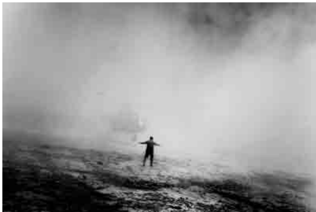
Un hélicoptère utilisé par la Drug Enforcement Administration et par les troupes afghanes atterrissant à Kaboul après avoir achevé une mission. Afghanistan, 2006

Sophie Marcilhacy : sophie@magnumphotos.fr / Tél : 01.53.42.50.25