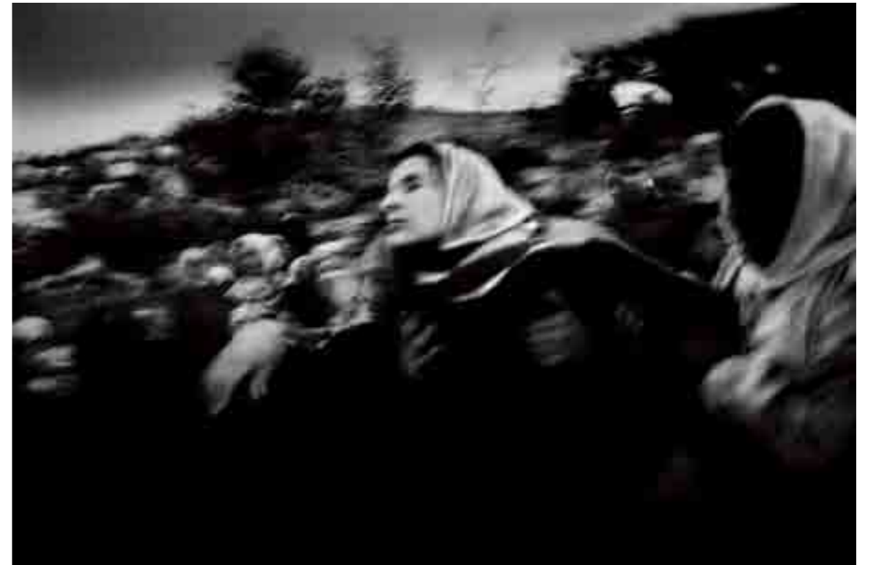
Une mère pleure son enfant tué pendant une incursion de l'Armée de défense israélienne à Jenin, Palestine, 2002

Extrait de l'entretien entre Paolo Pellegrin et Roberto Koch in Dies Irae , ed. Contrasto.